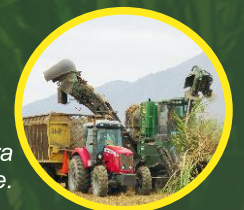
Cosechadora en verde.