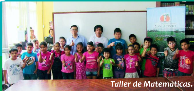
Taller de Matemáticas.