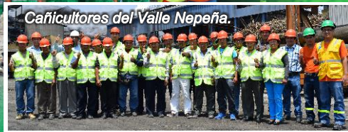
Cañicultores del Valle Nepeña.