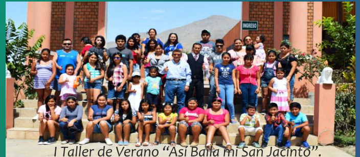
I Taller de Verano “Así Baila mi San Jacinto”.