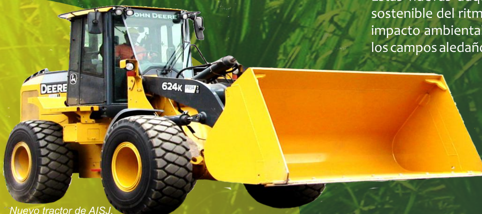
Nuevo tractor de AISJ.

Estas nuevas adquisiciones contribuyen al incremento sostenible del ritmo de la molienda; y a la mitigación del impacto ambiental, optimizando la cosecha en verde en los campos aledaños a la población.